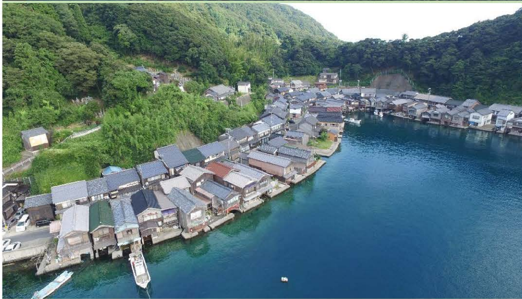
伊根浦伝統的建造物群保存地区 （伊根町）