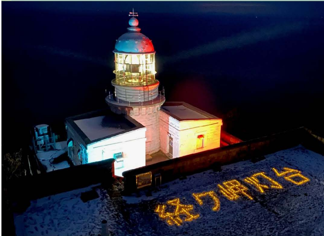
経ヶ岬灯台（京丹後市） （国の重要文化財の答申、 令和5年11月）