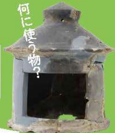
流水垂大下津町遺跡（京都市）