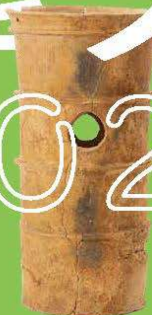
芝山古墳群（城陽市）