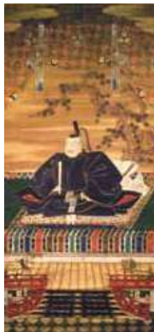
徳川家康像 正法寺蔵 家康の九男・徳川義直筆と伝わる 家康像です【前期展示】