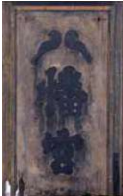
石清水八幡宮 一ノ鳥居古額 石清水八幡宮蔵 慶長5年8月に豊臣秀頼が奉納した額です