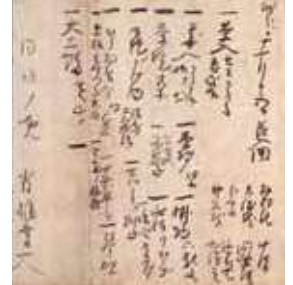
松花堂茶会記 松花堂昭乗筆 松花堂美術館蔵 昭乗が濂本坊の閑雲軒で開いた 茶会の様子がわかります

そして、松花堂昭乗も、八幡の安泰を願ったひとりです。当代きっての文人僧と称された昭乗は、八幡で醸成された茶の湯文化の中で、その才能を開花させました。昭乗の書画、茶の湯は、和やかさを基調としています。昭乗自筆の「松花堂茶会記」(松花堂美術館蔵)をはじめ、心を和ませる書や絵などをあわせてご紹介します。展示点数、約30点。