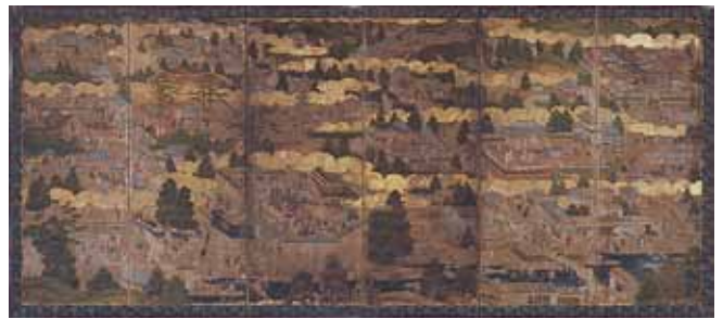
東山遊楽図屏風 松花堂美術館蔵 17世紀前期の京都東山界隈の景観が描かれています

17世紀初頭、石清水八幡宮の僧侶・松花堂昭乗(1584~1639)は、書画をよくし、茶の湯を愛した人物です。展覧会では、昭乗が生きた桃山時代から江戸時代に至る八幡に注目します。