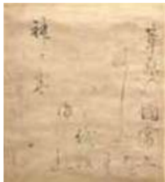
八幡名物 一休色紙 個人蔵 松花堂昭乗が愛蔵し、茶会でも 使用した一休和尚の色紙です