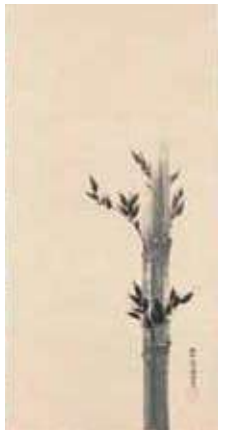
踊寿老竹梅図 三幅対 (中)松花堂昭乗(左右)萩坊乗円 個人蔵