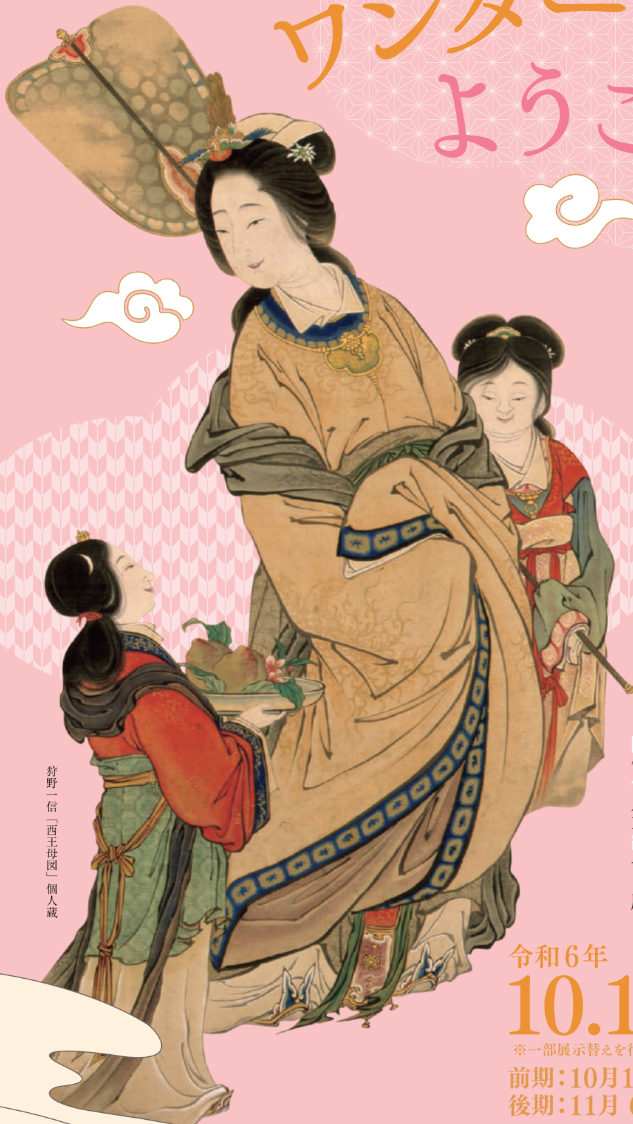
狩野一信「西王母図」個人蔵