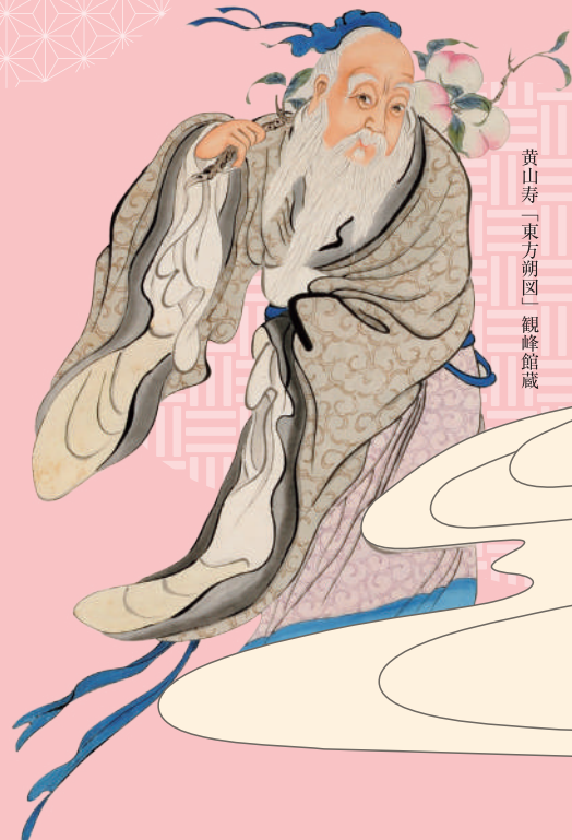
黄山寿「東方朔図」観峰館蔵

開催時間 午前9時～午後5時(入館は4時30分まで) 休館日 月曜日[10月14日(月・祝)、11月4日(月・振休)は開館] 10月15日(火)、11月5日(火) 観覧料 一般600円 大学生500円 18歳以下無料(大学生をのぞく) *団体(20名様以上) 一般480円 学生400円 庭園との共通券 一般840円 大学生670円 *団体 一般670円 学生540円