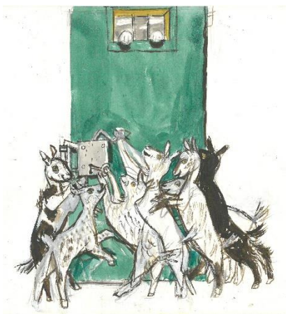
フェリックス・ホフマン 『おおかみと七ひきのこやぎ』 《こやぎたちドアをあける》1957年