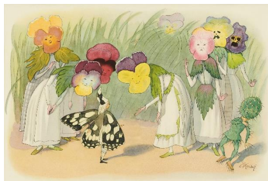
エルンスト・クライドルフ 『花を棲みかに（春の使い）』 《ママ母さん》1926年 小さな絵本美術館蔵