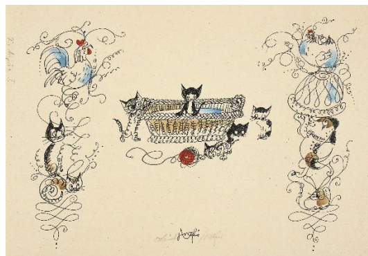
ハンス・フィッシャー 『こねこのびっち』 《扉》1948年 ©Hans Fischer 小さな絵本美術館蔵