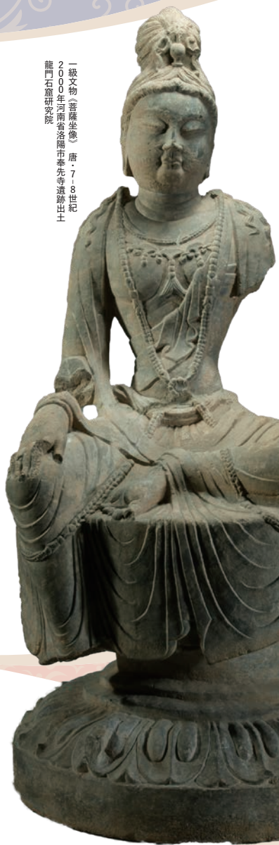
一級文物《菩薩坐像》唐・7-8世紀 2000年河南省洛陽市奉先寺遺跡出土 龍門石窟研究院

一級文物《妙法蓮華經卷第一 断簡》北朝・5-6世紀 1900年甘肅省敦煌莫高窟出土 敦煌研究院