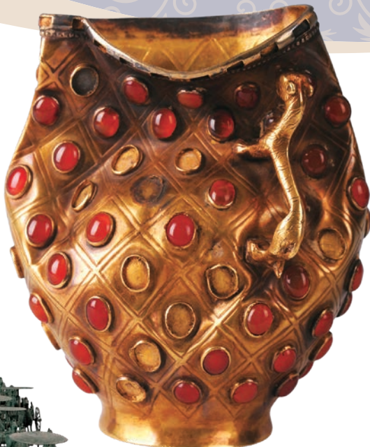
一級文物《瑪瑙象嵌杯》5-7世紀 1997年新疆ウイグル自治区イリ州昭蘇県ボマ古墓出土 イリ州博物館

東洋と西洋を結ぶシルクロードは、ユーラシア大陸を横断する重要な交易路です。古来、多くの人や物資が往来し、その要衝には多彩な文化が開きました。本展では、中国の洛陽、西安、蘭州、敦煌、新疆地域などで発見されたシルクロードの遺宝を紹介し、日本初公開を含む約200点の作品を通して、その悠久の歴史をお楽しみください。