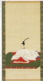
孝明天皇像 泉涌寺に伝来する