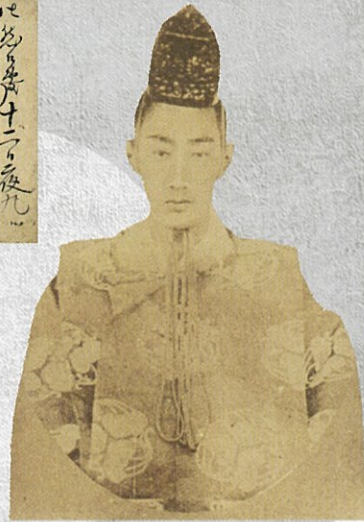
松平容保写真 慶応元年(1865年) 個人蔵(福島県立博物館寄託) (展示期間:通期展示)