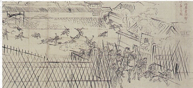
伏見鳥羽戦争図草稿(部分) 伝達藤蛙斎筆 明治時代(19世紀) 京都国立博物館蔵(展示期間:通期展示(半期で場面替))