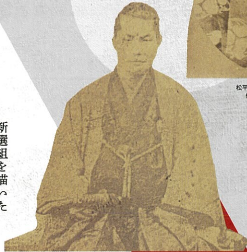
近藤勇写真 19世紀 土方歳三資料館蔵 (展示期間:10月1日~14日)