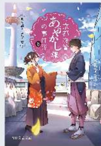
装丁：小川薫子（瀬戸内デザイン） 装画：ショウイチノ / PHP文芸文庫