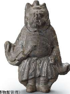
鍾旭像 京都府蔵 (京都文化博物館管理)