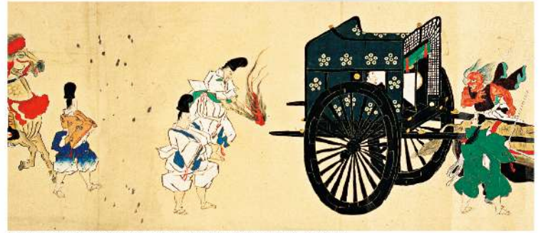
「繪巻物長谷雄脚逢羅城門鬼神之圖」(部分) 京都府立京都市・歴史館蔵