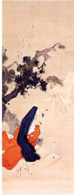
渡辺省亭「伊賀局」 京都府蔵（京都文化博物館管理）

我々の世界のすぐ隣には別の世界があり、そこにはこの世ならぬモノ達が棲んでいる。病気や災害などの災厄は、そうした世界の住人からの干渉が生み出す現象なのではないか？人びとは身の回りに起こる不可思議な現象を異界との邂逅として解釈してきました。そして異界から何か悪いモノがやってくるようにと様々な呪法が編み出され、魔よけやまじないが修されてきたのです。この展覧会では、人びとが異界に向けてきたまなざしに着目し、それがどのように表現されてきたのか、そして異界からの侵蝕に対して、人びとはどのように対処してきたのかについて、関連資料の展示等によって紹介します。