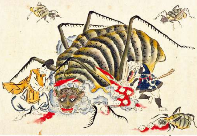
「土蜘蛛之草紙」(部分) 京都府立京都市・歴史館蔵