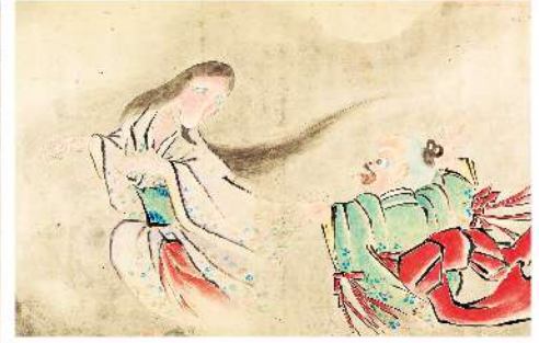
「化物絵巻」(部分) 京都府立京都市・歴史館蔵