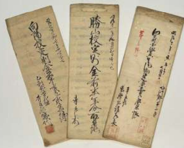
上 向陽尋常小学校正門・本館 昭和2年(1927)／中 向陽校本館新築断面図 明治42年(1909)、授業風景 昭和4年(1929)、 小学校建築費・定期金取集帳 明治11～12年(1878～79)／下 昭和8年(1933)前後の教科書と家庭学習机