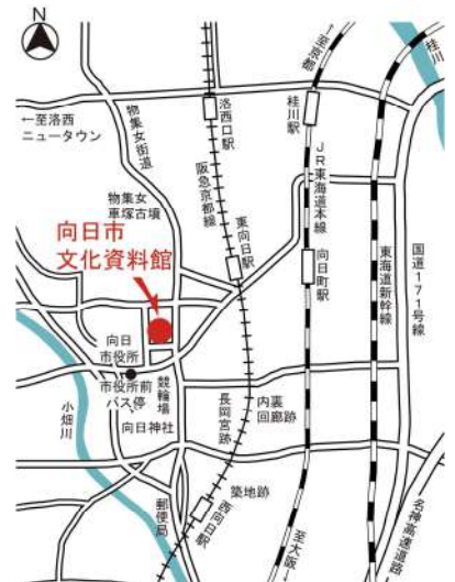
阪急東向日駅から徒歩8分・JR向日町駅から徒歩15分

今から45年前の昭和52年(1977)に向陽小学校で発見された5巻の16mmフィルム。そこに映っていた昭和8年(1933)の校舎増築竣工式や奉安殿の建築工事、遊戯や運動会、学校前の向日町商店街のお店、当時の役場や地区の事務所を、教育150年記念展にあわせて再編集し、解説をくわえて5本の番組ができました。展示室で放映していますので、ぜひご覧ください。