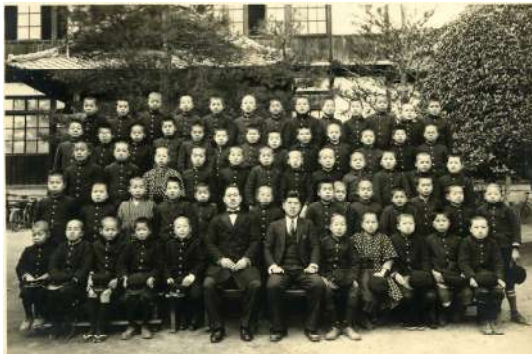
向陽尋常小学校卒業生 昭和8年(1933)卒業写真帖より