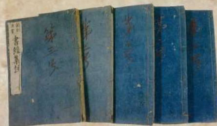
亀山藩校引継資料