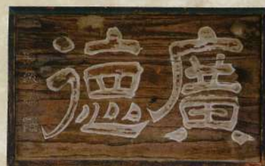
広徳館扁額（亀岡小学校所蔵）