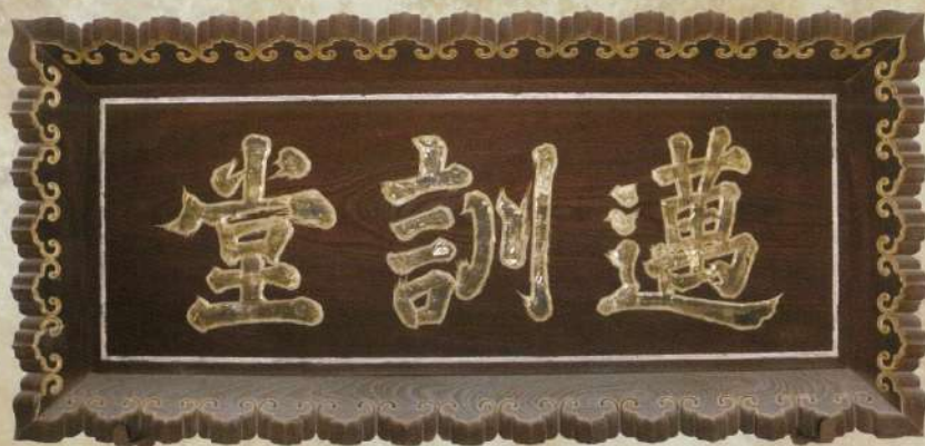
邁訓堂扁額（亀岡小学校所蔵）

本展示会では近代学校の教育について紹介するとともに、その立役者である村々の庄屋層のうけた教育や彼らが形成した文化ネットワークに注目するとともに、亀山藩の藩校教育についても紹介します。