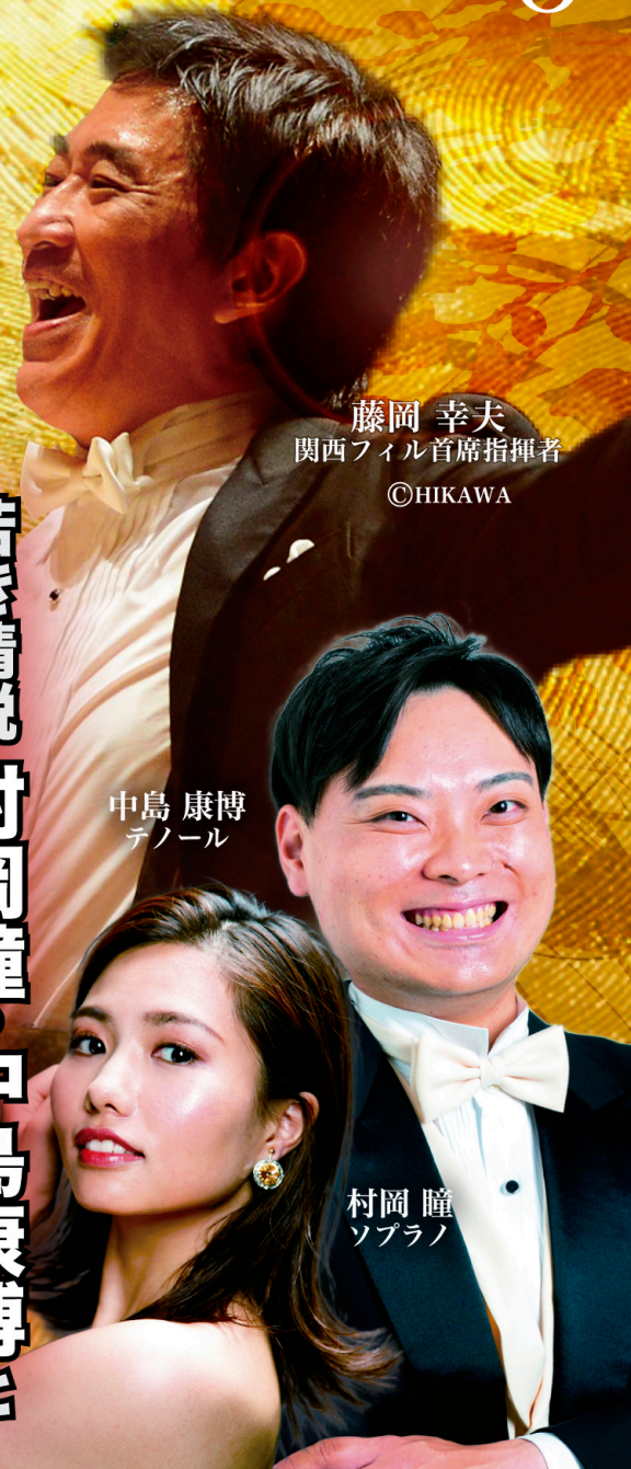
藤岡 幸夫 関西フィル首席指揮者