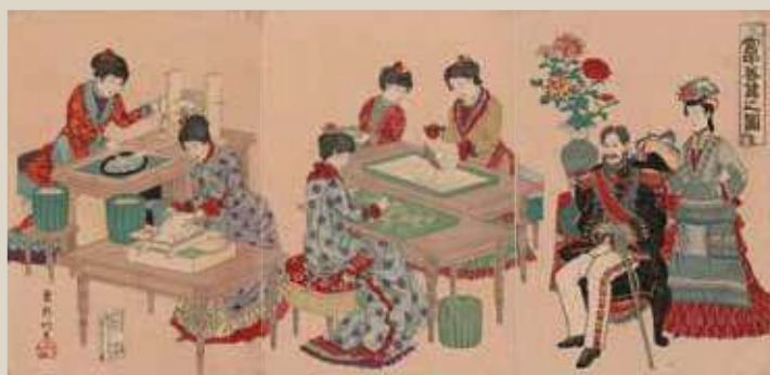
翠軒竹葉(生没年不詳)『宮中養蚕之図』

軍服姿で椅子に座り女官たちを見守る明治天皇。その傍らに立つ皇后は裾の広がったスカートで頭には羽飾りの帽子を身につけている。作業をする女官も全員洋装であり、服装からも日本の近代化が感じられる。