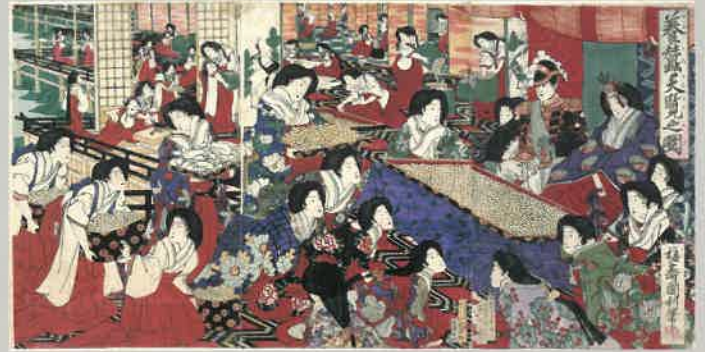
歌川(梅寿) 国利 『養蚕天覧之図』

浮世絵は、江戸時代から明治時代にかけて、当時の暮らしや風俗、流行をあらわすものとして数多く描かれ、なかでも多色刷りの木版画である「錦絵」は庶民の間で人気がありました。「蚕織錦絵」とは、蚕の誕生から絹織物が出来るまでを描いた錦絵の総称であり、グンゼの祖業である蚕糸業にまつわる錦絵を230枚所有しています。今回は創立125周年を記念し、グンゼのあゆみを紹介する貴重な写真とともに、10点以上の錦絵を公開いたします。リニューアルした未来蔵で、明治から大正へ受け継がれた歴史と芸術をお楽しみください。