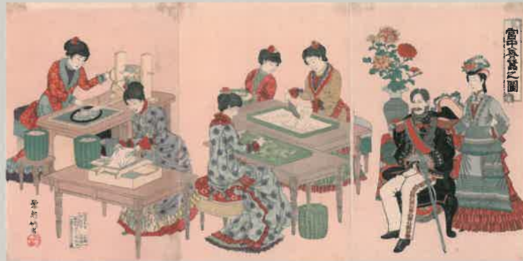
翠軒竹葉 『宮中養蚕之図』

現在でも皇室で行われている御親蚕(皇后さまが自ら蚕を飼育)は、明治天皇の皇后さまである昭憲皇太后が明治4年に始められたのが最初であり、明治政府とともに皇室も積極的に蚕糸・絹業を推奨しました。そのため、皇室にまつわる多くの錦絵が描かれました。色鮮やかで華やかな宮中をご覧ください。