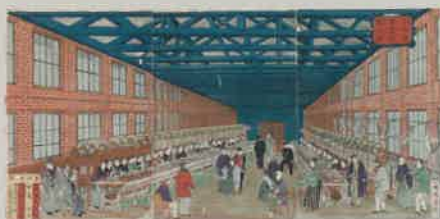
歌川(一暉齋) 国輝 『上州富岡製糸場』