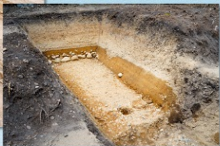
久津川車塚古墳後円部下段出土状況

発掘調査速報展では 久津川車塚古墳や芭蕉塚古墳、 芝山古墳群の発掘調査成果を ご紹介いたします!