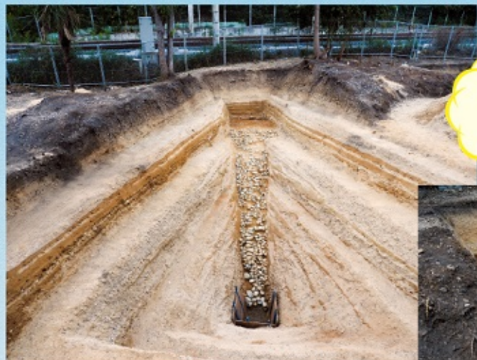
久津川車塚古墳後円部下段出土状況

発掘調査速報展では 久津川車塚古墳や芭蕉塚古墳、 芝山古墳群の発掘調査成果を ご紹介いたします!