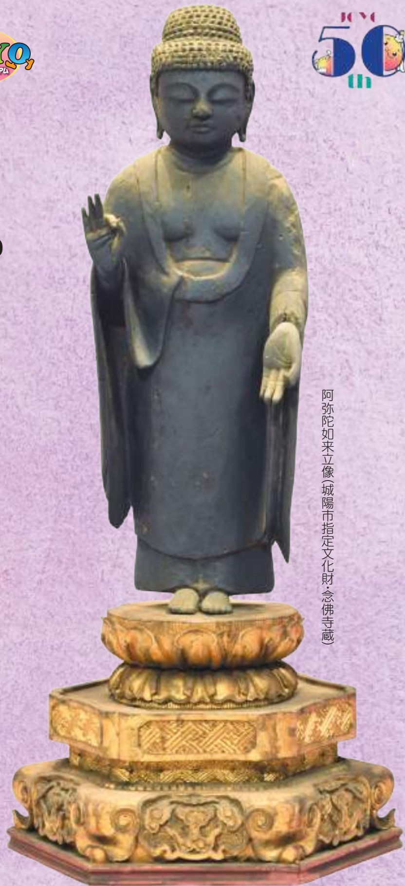
阿弥陀如来立像(城陽市指定文化財・念佛寺蔵)