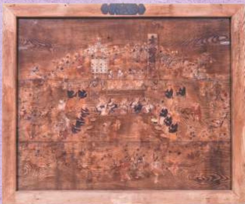
おかげ踊図絵馬(京都府登録文化財・水度神社蔵)