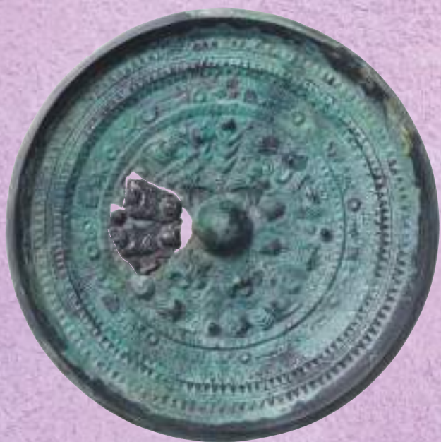
西山2号墳出土 三角縁獣帯四神四獣鏡 (同志社大学歴史資料館蔵)