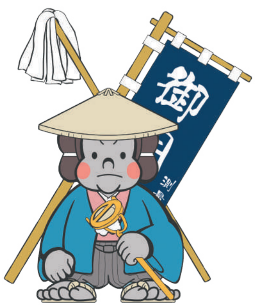
資料館マスコット「ごりごりくん」

日時：11月12日(日) ①11:00~②13:30~ ③14:30~ 対象：小学生以上 定員：各回先着5名 参加費：無料 申込：11月5日(日)10時から電話申込 (お1人様につき2名分まで申込可)