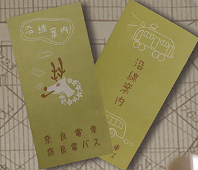
沿線案内