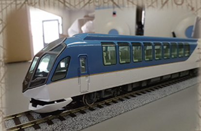
HOゲージ しまかせ 近鉄グループホールディングス(株)蔵