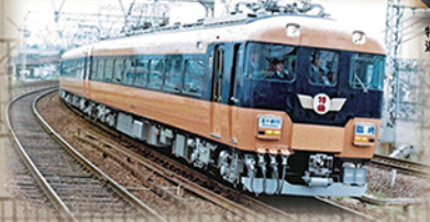
エリサベス英女王ご乗車 お召列車