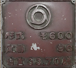
モ600車両プレート 近鉄グループホールディングス(株)蔵