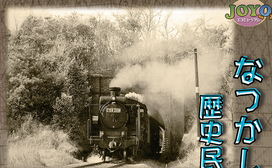
山城青谷駅—山城多賀駅間のトンネルを走る蒸気機関車 昭和46年(1971年)4月