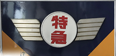
特急12200系ヘッドマーク 近鉄グループホールディングス(株)蔵