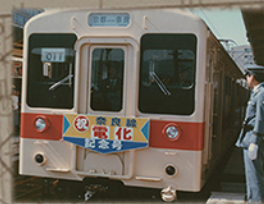
奈良線電化記念号