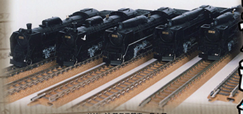
Nゲージ 蒸気機関車 個人蔵