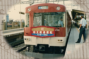
近鉄・京都地下鉄相互直通運転記念号